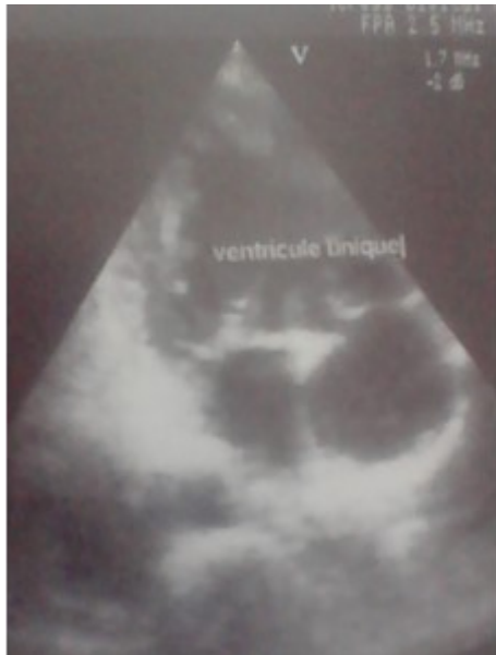
Figure 2 : Echographie doppler cardiaque en coupe quatre cavités montrant un ventricule unique dans lequel s'abouche les oreillettes droite et gauche

L'échographie doppler cardiaque a mis en évidence une malformation cardiaque à type de deux oreillettes connectées à un ventricule unique. Ce ventricule unique, est morphologiquement gauche, les valves mitrale et tricuspide s'abouchant dans une seule cavité ventriculaire. (Figure 2).